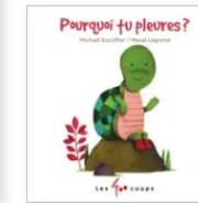
Pourquoi tu pleures ? Michaël Escoffier